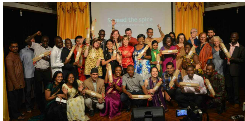
Graduation Kanthari 2014

In 2014 waren er 22 deelnemers uit 11 landen, zoals Gambia, Ghana, Mauritius, Myanmar, Nepal, Servië, Oeganda en Zimbabwe.