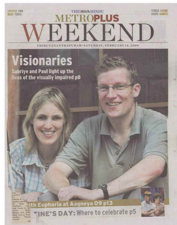
Frontpage The Hindu 14-02-2009

van allerlei obstakels in hun leven, uitstekende voelhorens hebben gekregen voor de sociale problemen in hun land, en dat ze in hun strijd tegen dagelijkse discriminatie voldoende kracht en zelfvertrouwen hebben ontwikkeld om problemen in hun eigen omgeving te willen oplossen.