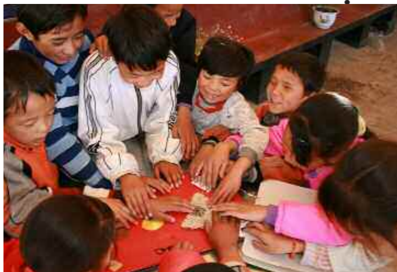
Leerlingen in Lhasa voelen aan een tactiel beeld

We hebben nieuwe kinderen opgenomen. In het begin waren ze een beetje schuchter, maar dat verdween al snel.